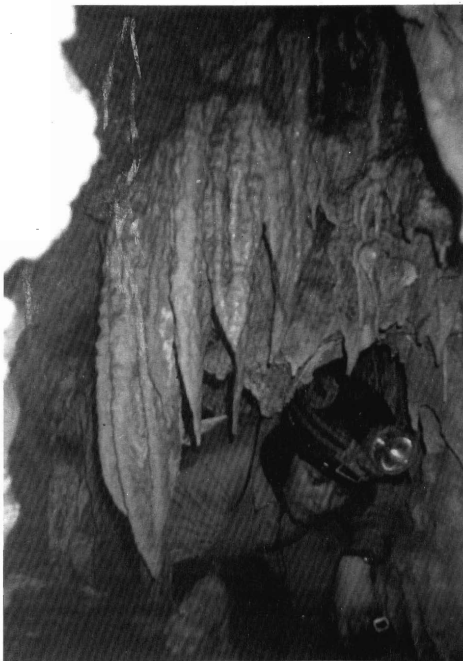
Σπήλαιο «Γεύκου», Μετόχι Δίρφυος Ευβοίας.