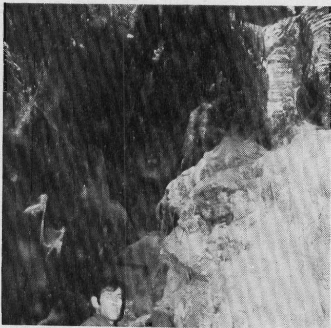
Δεξιὰ τῆς Ἑστίας «Καπνοδόχη».

2ον. Τὸ πρὸς τὰ δεξιὰ ἑδρανὸν — τὸ μεγαλύτερον εἰς μῆκος καὶ πλάτος — ἔχει ὑποστῆ καὶ ἐπεξεργασίαν κατακόρυφον πρὸς τὰ κάτω. Ἐν τμήμα τοῦ ἑδράνου παρουσιάζεται μὲ 2 ὕψη. Τὴ χαμηλότερον εἶναι πολὺ μικρότερον τοῦ ὑψηλοτέρου.