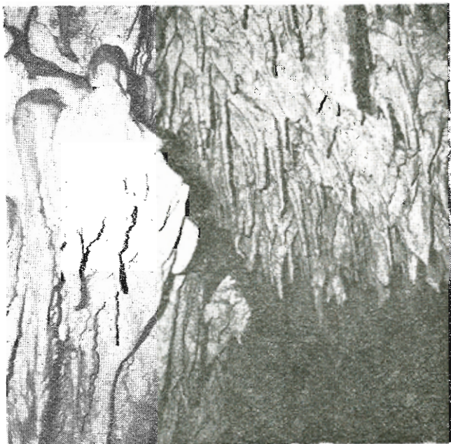
Τὸ τρίτον τμήμα τοῦ σπηλαίου μετὰ ωραιότατο διάκοσμο.

Τὸ τρίτον καὶ τελευταῖον τμήμα τοῦ σπηλαίου διαστάσεων 9X1, 5X2—4 μ. εἶναι ἀπλῶς κατηφορικὸν καὶ πλουσιώτατα διακοσμημένον ὑπὸ σταλακτιτῶν καὶ σταλαγμιτῶν. Ἐπίσης εἰς τοῖχοι τοῦ ὀρους καὶ τοῦ δευτέρου τμήματος εἶναι καλυμμένοι ὑπὸ σταλακτιτικοῦ διακόσμου πολὺ ἐντυπωσιακοῦ. Πρὸς τὸ τέλος του, εἰς ὕ-