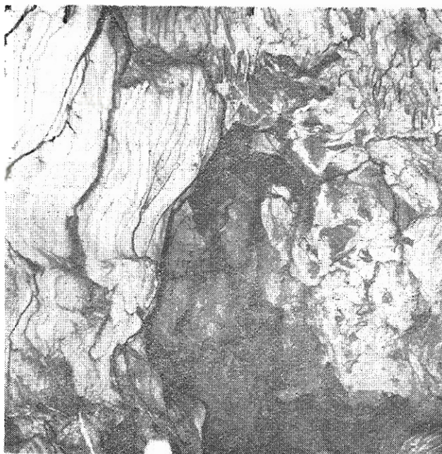
Ἡ «Βωμὸς» εἰς τὸ τέλος τοῦ σπηλαίου.

Θερμοκρασία—Υγρασία: Ἡ θερμοκρασία τοῦ σπηλαίου τὴν 11—11—70 ἦτο 180 C Ἡ ὑγρασία 75 ο/ο.