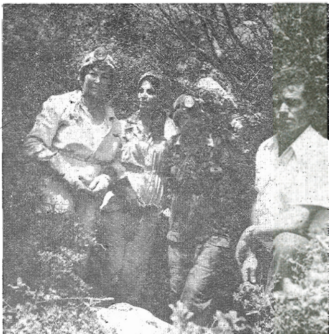
Τὸ κλιμάκιον τῆς Ε.Σ.Ε. παρὰ τὴν εἴσοδον τοῦ σπηλαίου.

Περιγραφή τοῦ σπηλαίου: Ἡ εἴσοδος τοῦ σπηλαίου εὑρίσκεται εἰς τὸ ἀνώ- τατο σημεῖον κλιτύος θλέπουσα πρὸς Ν.Α. Αἱ διαστάσεις τῆς εἶναι: πλάτος 1,55 X 1 μ. ὕψος.