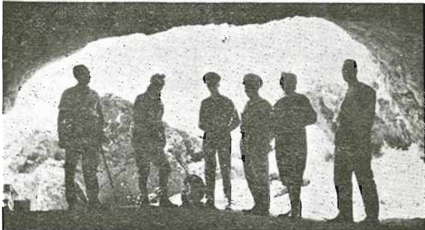
Ἡ εἴσοδος τοῦ Σηηλαίου ἐκ τῶν ἔσω πρὸς τὰ ἔξω.

Ὀλόκληρος ὁ θάλαμος ἔχει εἰς τοὺς τοίχους του ὠραῖον καὶ πλούσιον διάκοσμον. Διεπιστώθη ὅτι τὸ δάπεδον τοῦ θαλάμου ἔχει προσχωθῆ ἀρκετά, διὰ φερτῶν ὕλικῶν