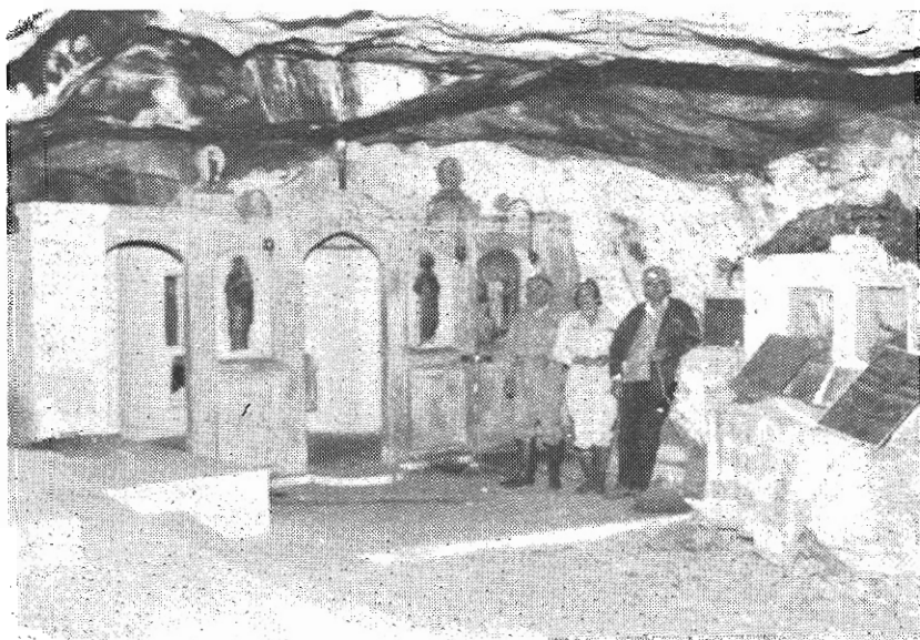
Τὸ ἐκκλησάκι καὶ δεξιὰ τοῦ τὸ ἥρωον.

Τὸ σ π ῆ λ α ι ο ν : Ἡ ἐπίσκεψις τοῦ σπηλαίου πραγματοποιεῖται διὰ σειρᾶς διανοιγμένων εἰσόδων εἰς ἔκτασιν 40μ. καὶ εἰς τρία κλιμακωτὰ ἐπίπεδα, τὰ ὁποῖα ἑνομάσαμεν «Τρία τμήματα»: Τὸ «Κεντρικόν» μὲ μίαν εἴσοδον, τὸ «Δεξιόν» κατὰ δύο μέτρα χαμηλότερον τοῦ Κεντρικοῦ, μὲ μίαν εἴσοδον καὶ τὸ «Ἀριστερὸν» τμήμα κατὰ δύο μέτρα ὑψηλότερον τοῦ Κεντρικοῦ μὲ 6 κατὰ σειρὰν εἰσόδους διαφόρων μεγεθῶν.