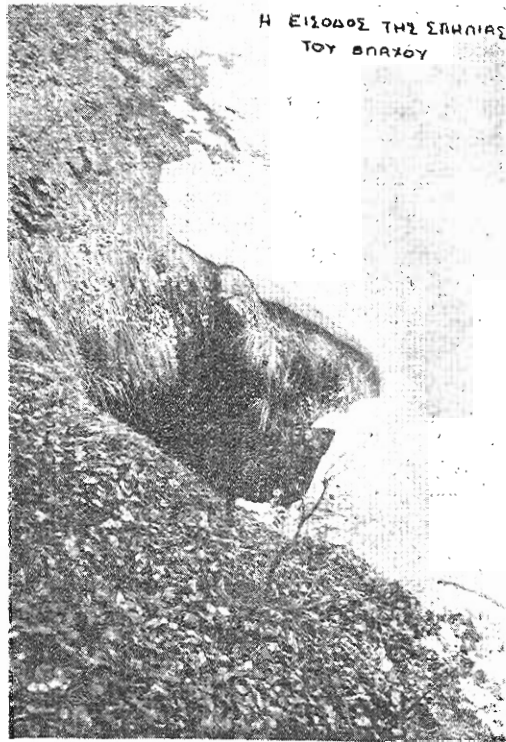
Ἡ εἴσοδος τῆς σπηλιάς.

Πλησίαζε Πάσχα. Ὁ Κωστάκης ζήτησε ἀπὸ τὸν πατέρα του νὰ τοῦ δώσει τὸ