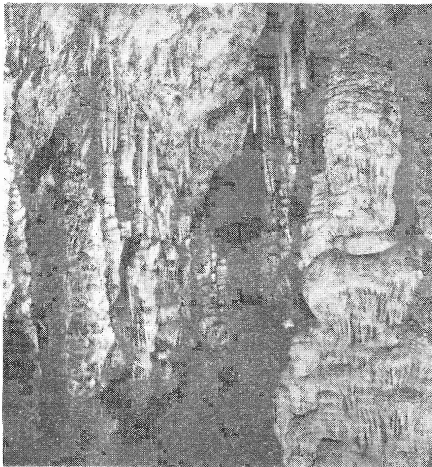
Δικταῖον Ἄντρον. Ἡ λίμνη τοῦ Διός.

Ἡ διεύρυνσις καὶ ἐκβάθυνσις τῆς εἰσόδου τοῦ μεταγενέστερα εἶχε ὡς ἀποτέλεσμα ἐκτὸς τῆς ἐνώσεως τῶν δύο τμημάτων τοῦ (B-N) καὶ τὴν κάλυψιν τοῦ δαπέδου τοῦ ἐκ τῶν κυλισθέντων ὄγκολίθων καὶ ἐν συνεχείᾳ ὑπὸ τῶν φερτῶν ὑλικῶν.