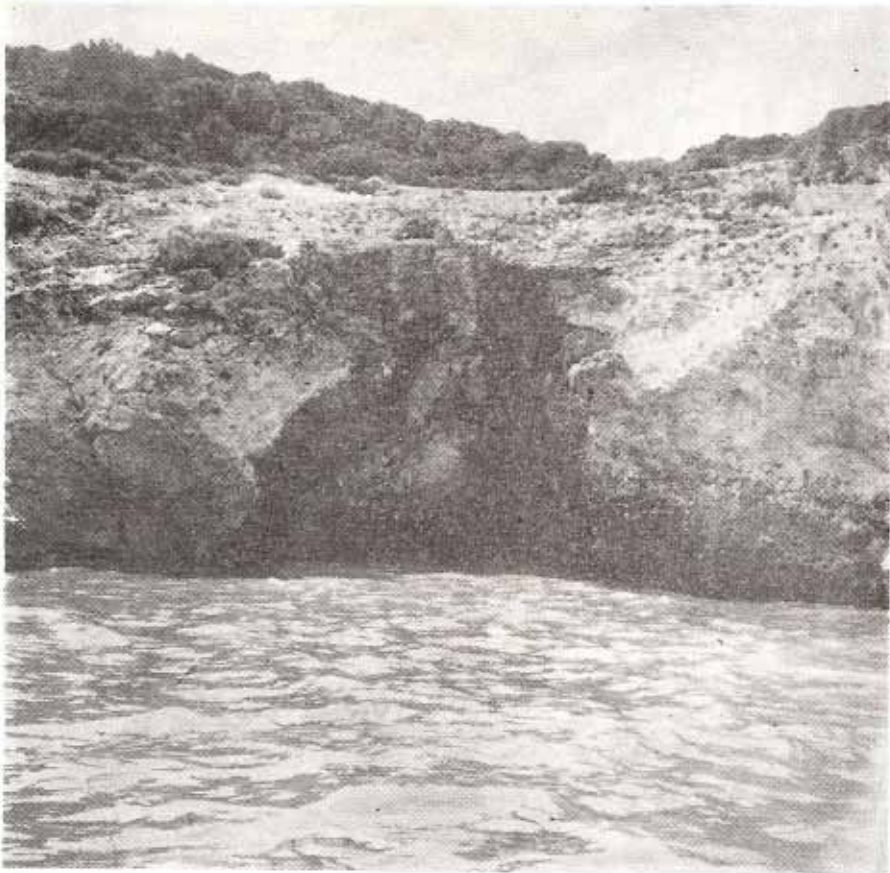
Σπήλαιον Ζύγγια. Εἰσοδος

Τὸ σπήλαιον Ζύγγια θεωρεῖται τουριστικὸν γενικοῦ ἐνδιαφέροντος, διὰ καταλλήλου δὲ διευθετήσεως, δύναται νὰ θεωρηθῇ ἀντάξιον τοῦ διεθνoῦς φήμης τοιοῦτου παρὰ τὸ Κάπρι τῆς Ἰταλίας GROTTO AZZURRA. Τῆς Ζακύνθου ὁμως ἔχει καὶ τὸ μοναδικὸν πλεονέκτημα τῆς ἐκβαλλούσης ἐντὸς αὐτοῦ ἰαματικῆς πηγῆς. Σύνδρομα τουριστικὰ στοιχεῖα εἶναι ὅλα τὰ προαναφερθέντα.