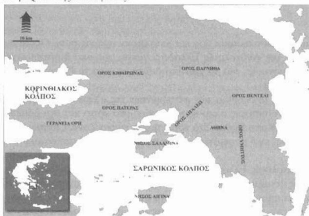
Εικ. 1. Η γεωγραφική θέση της Σαλαμίνας.

Η Σαλαμίνα είναι το μεγαλύτερο νησί του Σαρωνικού Κόλπου και το πλησιέστερο στις ακτές της Αττικής (Εικ.1). Βρίσκεται στο βόρειο τμήμα του Σαρωνικού και χωρίζεται από τις ακτές της Αττικής με το Στενό της Πάχης (δυτικά) και το Στενό του Περάματος (ανατολικά). Οι δύο αυτοί διάυλοι οριοθετούν τον Κόλπο της Ελευσίνας που εκτείνεται βόρεια της Σαλαμίνας.