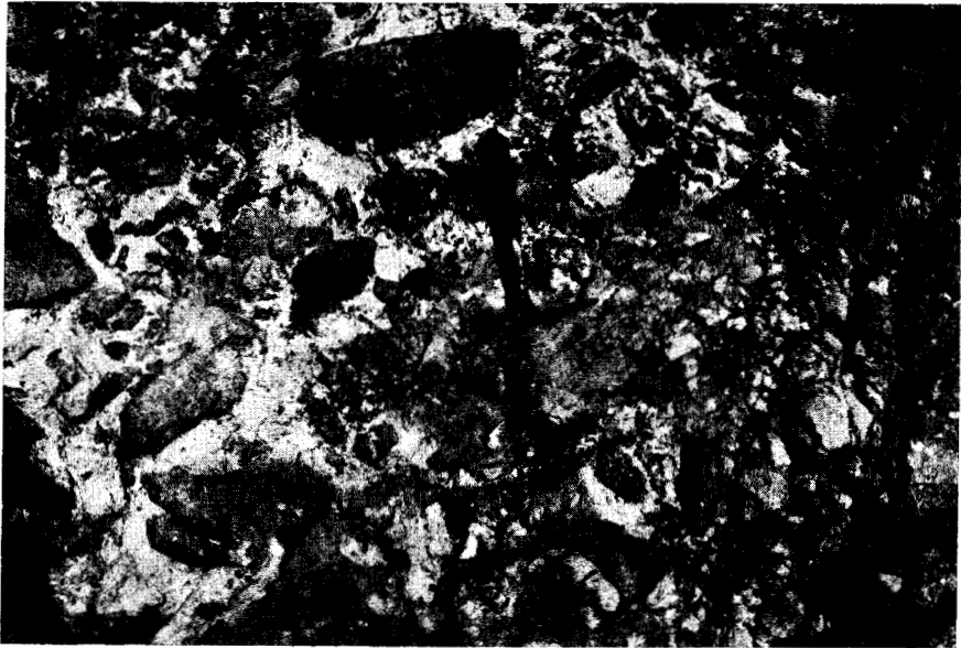
Abb. 2. Basalkonglomerat der Rotmergel-Serie in Amygdalea.

Im Dorf Amygdalea selbst liegt die Rotmergel-Serie — unter Ausfall der pelagischen Kalke — einem unverkennbaren Relief des Oberkreide-Kalkes auf. An ihrer Basis ist ein Konglomerat entwickelt, in dessen z. T. weisslich-gelber, sandiger Mergel-Grundmasse