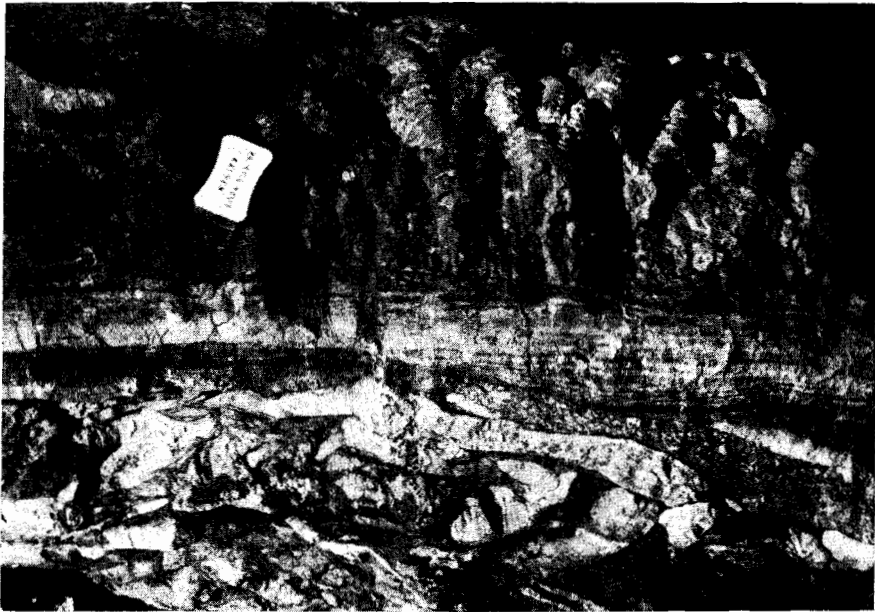
Abb. 4. Die Manganerz-Lage bei Aghioi Pantas. Man erkennt die gekröseartige Oberfläche sowie die subaquatischen Rutschkörper in ihrem Liegenden.

wieder werden die Komponenten bis kopfgross. Auch noch 2-3 m über ihrer Basis führen die roten Mergel kleinere und grössere Fragmente. Letztere bestehen überwiegend aus rudisten-führenden Kalken. Gelegentlich treten auch Kalke mit Cladocoropsis mirabilis FELIX auf, so dass