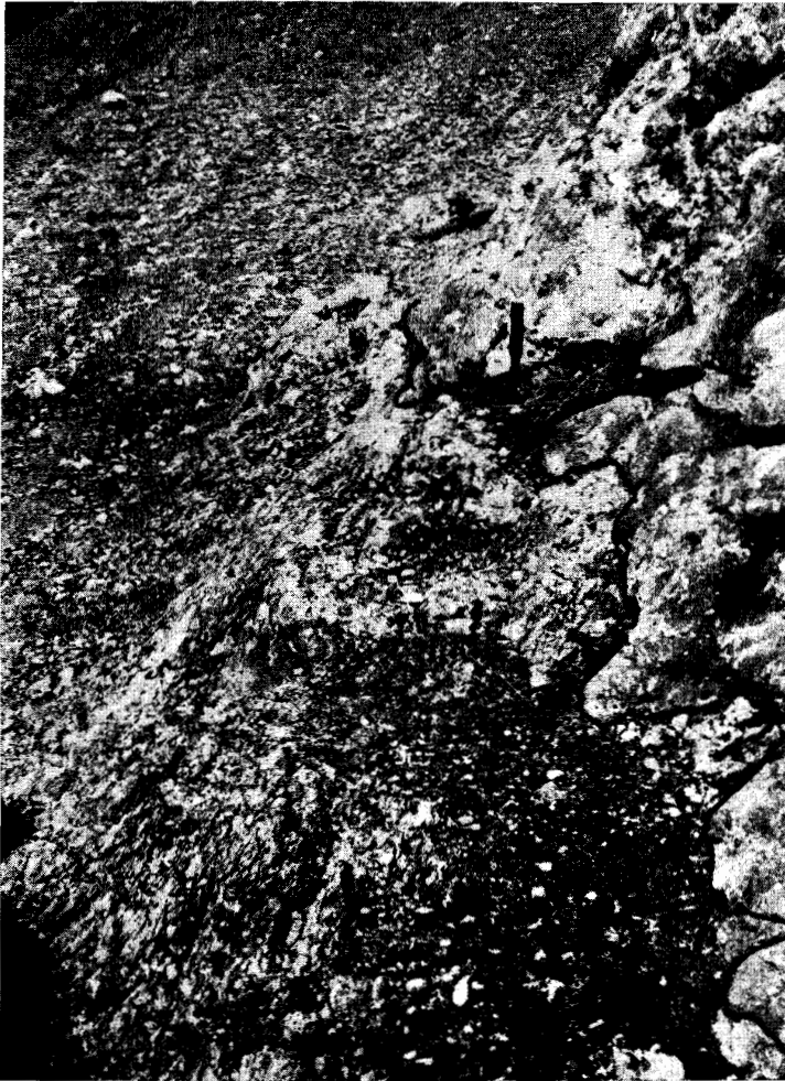
Abb. 3. Paläorelief des Unterkreide-Kalkes mit auflagerndem grauen Basalmergel der Rotmergel-Serie 2,5 km südlich Malandrion.

Etwa 200 m südlich des oben erwähnten Friedhofes liegt die Rotmergel-Serie auf der Westflanke des Kalkstein-Zuges ebenfalls einem deutlichen Relief des Oberkreide-Kalkes 3 auf, wobei die Höhenunterschiede zwischen den einzelnen Erhebungen und Vertiefungen mehrere Meter