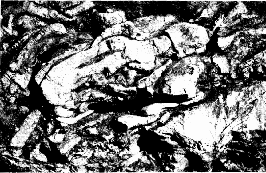
Abb. 5. Blick auf die abgedeckte Schicht mit subaquatischen Rutschungen bei Aghioi Pantos.

Etwa 2,5 km südlich Malandrinos ist der unmittelbare Sedimentärkontakt zwischen den basalen Schichten des Flysches und den Unterkreide-Kalken aufgeschlossen. Eine Störung tritt hier nicht auf, sondern es besteht eine Schichtlücke zwischen dem Flysch und seinem Liegenden, welche die gesamte Ober-Kreide umfasst. Die Oberfläche des Kalkes