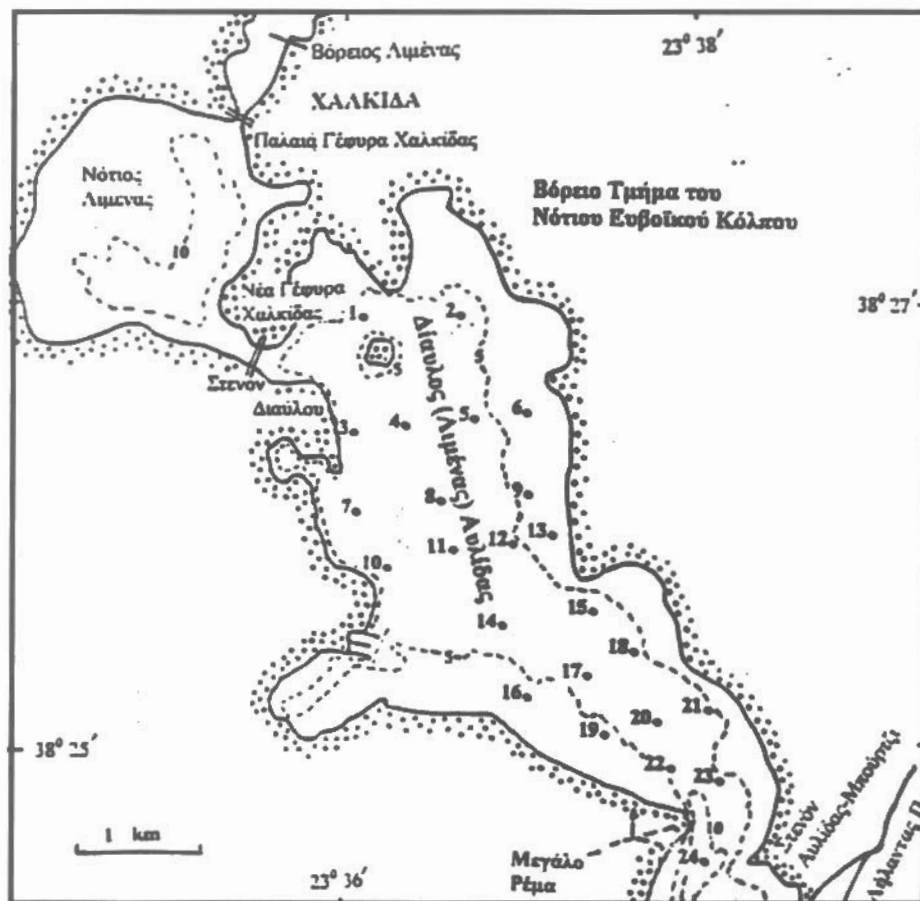
Σχ. 1 : Απλουστευμένος χάρτης της περιοχής μελέτης και θέσεις σταθμών μέτρησης. Fig. 1.: Simplified map of the study area and position of sampling stations.

Το υδρολογικό καθεστώς καθορίζεται κυρίως από το παλιρροϊκό φαινόμενο που στην περιοχή της Αυλίδος