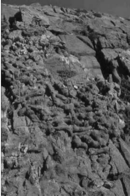
Φωτογραφία 2. Λεπτομέρεια από σπογγοαποικία στον Ψηλορείτη (για κλίμακα, στο μέσο της φωτογραφίας το υψομετρικό).

από την in situ αποδόμιση προϋπαρχόντων σπόγγων, από την συνολική εικόνα των αποικιών πιθανώς να πρόκειται για σπόγγους Siphoniidae και Rhizomorina (Manutsoglu E. et al. 1995b).