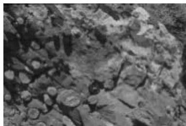
Φωτογραφία 3. Μαύρα δολομιτικά μάρμαρα με σπογγοαποικία, φωτογραφία 4 (δεξιά), λεπτομέρεια της προηγούμενης φωτογραφίας, με απολιθωμένους σπόγγους.

διαμέτρου εκατοστών, εξελίσσονται από 3-4 μέτρα υποκίτρινου σερικιτικού χαλαζίτη. Ο χαρακτηριστικός αυτός σχηματισμός στον μεν Ταΰγετο έχει χρονολογηθεί Μάλμιο (Thiebault 1982), στην Κρήτη δε, και δη στην περιοχή Ασφένδου οι Krahl et al. (1988) αναφέρουν ότι έχουν εντοπίσει τρηματοφόρα και ραδιολάρια του Άππιου και Ανωτέρου Κενομανίου (τα στοιχεία αυτά δεν έχουν ακόμη δημοσιευτεί). Όσον αφορά τους κονδύλους για πολλές δεκαετίες θεωρούντο διαγενετικά συγκρίματα. Όπως διαπιστώθηκε διακρίνονται δυο χαρακτηριστικές ομάδες κονδύλων. Διαγενετικά συγκρίματα όπου το πυριτικό υλικό είναι ομοιογενώς κατανεμημένο και στο μικροσκόπιο δεν εμφανίζει κα-