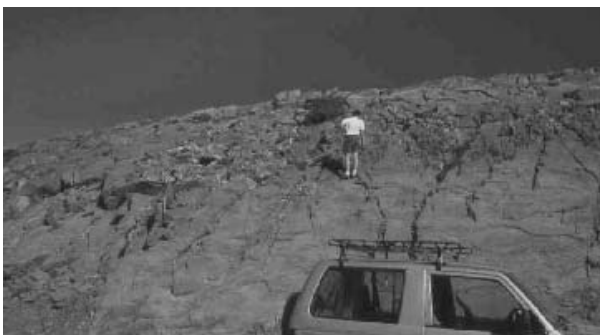
Φωτογραφία 1. Πανοραμική άποψη των σπογγοαποικιών στον Ψηλορείτη.

Αν και οι συνθήκες μεταμόρφωσης δεν επιτρέπουν μια σίγουρη ερμηνεία των ευρημάτων επέτρεψαν τις εξής θεωρήσεις: α) Πρόκειται για απολιθωμένους δημόσπογγους που σχημάτισαν επάλληλα 'flat sponge mounds', β) τα υποστρώματα πάνω στα οποία αναπτύχθηκαν οι αποικίες πιθανώς να ήταν σπικουλίτες, που προκύψαν