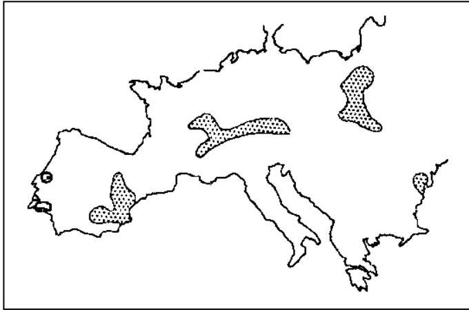
Σχήμα 1. Εμφανίσεις φάσεων πυριτοσπόγγων του Ανωτέρου Ιουρασικού στον Ευρωπαϊκό χώρο (από Leinfelder et al. 1993).

ρετικά γεωλογικά περιβάλλοντα από εσωτερική πλατφόρμα ανθρακικής ιζηματογένεσης μέχρι και εσωτερικό ήβωμα (σχ. 1).